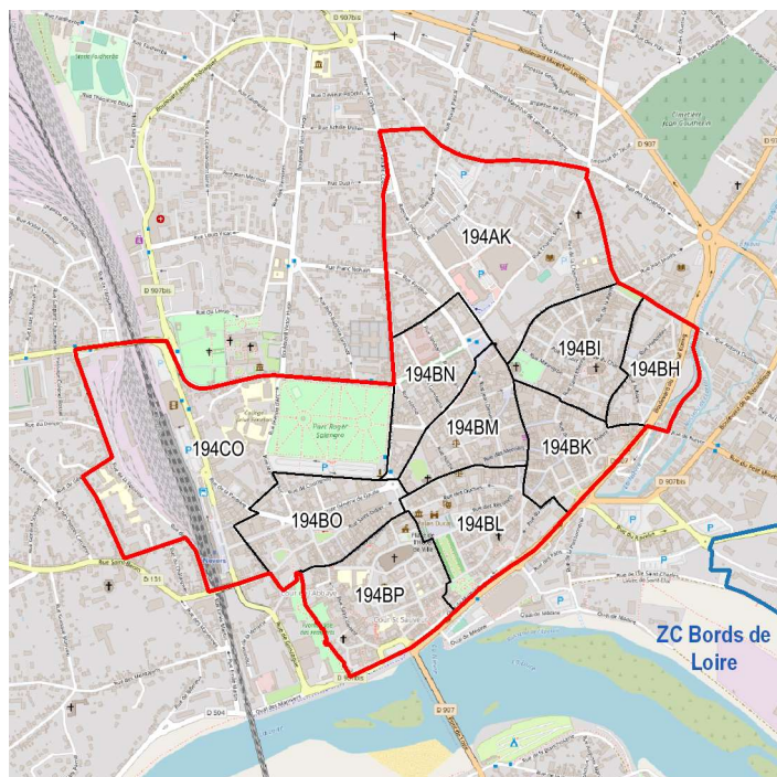
Centre-ville de Nevers